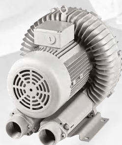
TKW15 1,5 kW